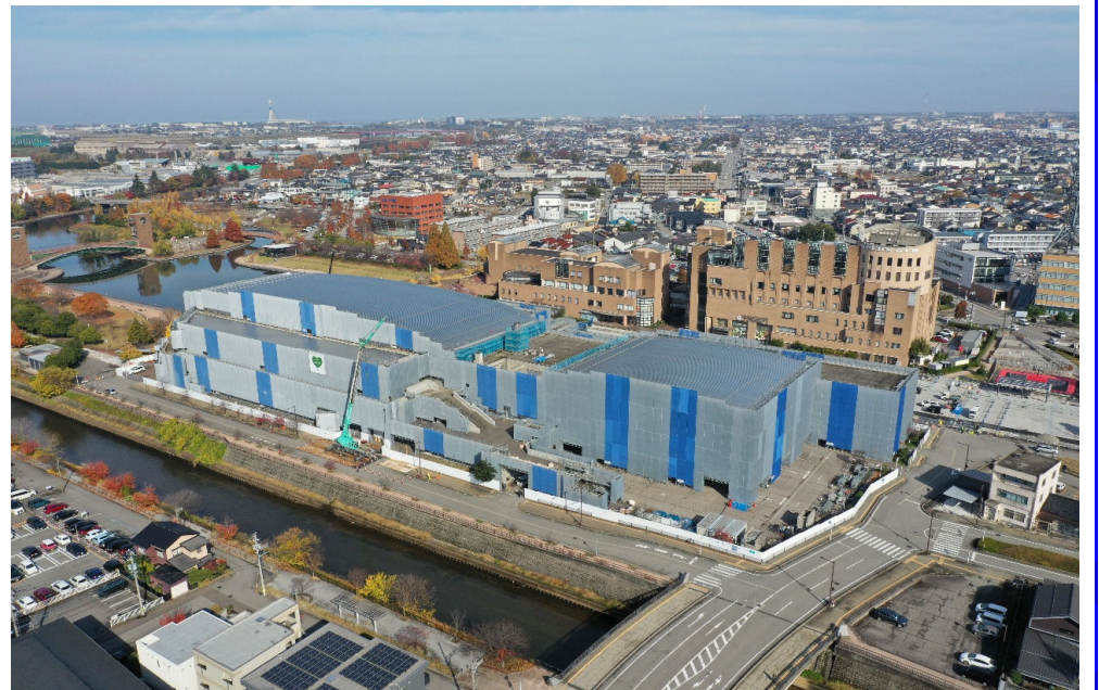
全景写真(南東上空より撮影)